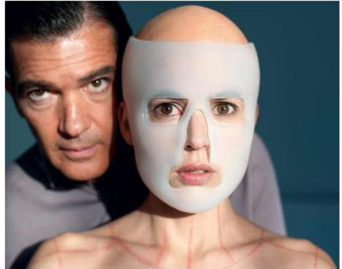
La Piel que habito , film de Pedro Almodóvar, 2011.

Dans son laboratoire privé, le chirurgien esthétique Robert Ledgard cherche à créer une peau artificielle qui aurait pu sauver sa femme, victime de graves brûlures. Pour mener à bien ses recherches, il a besoin d'un cobaye.