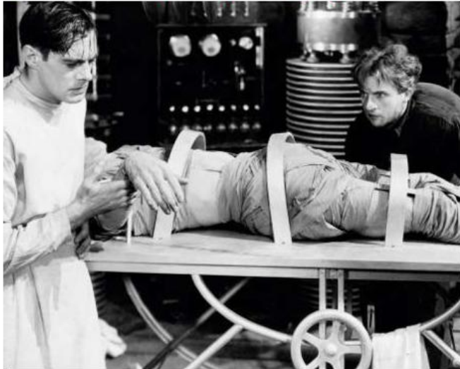
Frankenstein , film de James Whale, 1931.

Le jeune savant Henry Frankenstein a l'idée de rassembler les morceaux d'un cadavre pour en faire un être vivant. C'était sans compter l'erreur de son assistant Fritz, qui apporte malencontreusement le cerveau d'un assassin.