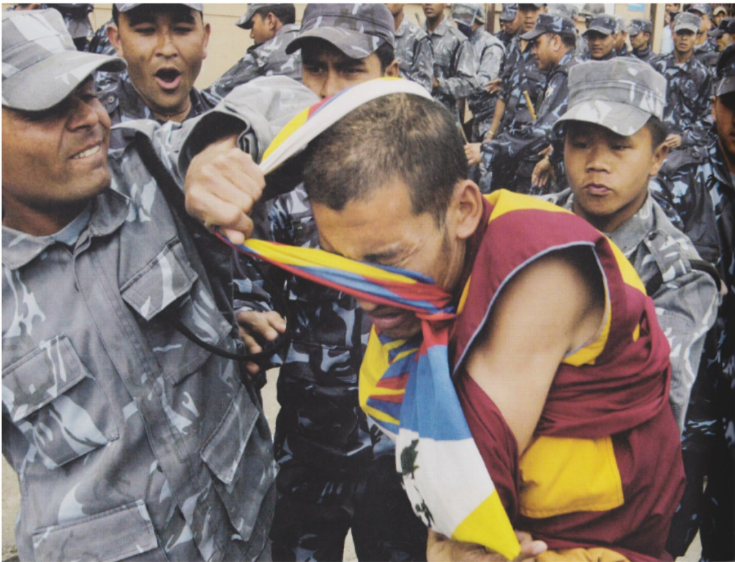
Le drapeau permet de localiser l'action