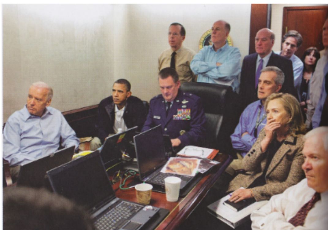
La référence culturelle (série télévisée) banalise la scène.